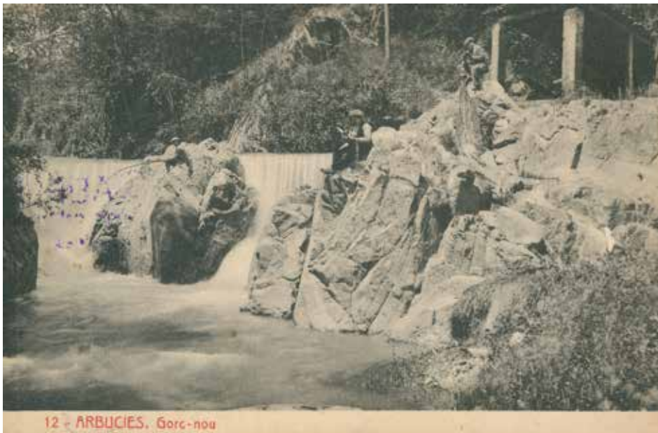
12 - ARBUCIES. Gorg-nou

És a la riera d'Arbúcies, a sota de la resclosa del molí del Roquer.