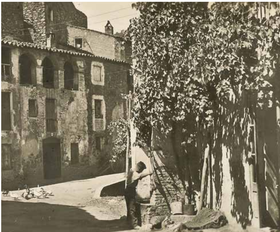
Font de Bomba del Carrer Castell

(V. VIII, pàg. 809-810, Diccionari Català-Valencià-Balear , Alcover-Moll)