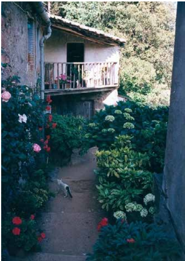
Molí del Regàs

ADV, Fons del monestir de St. Llorenç del Munt, sobre Cerdans.