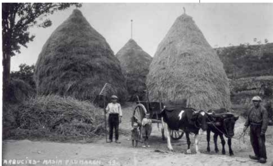
Can Pau March