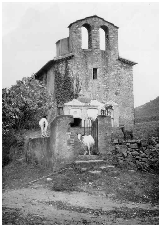
Santa Maria de Lliors