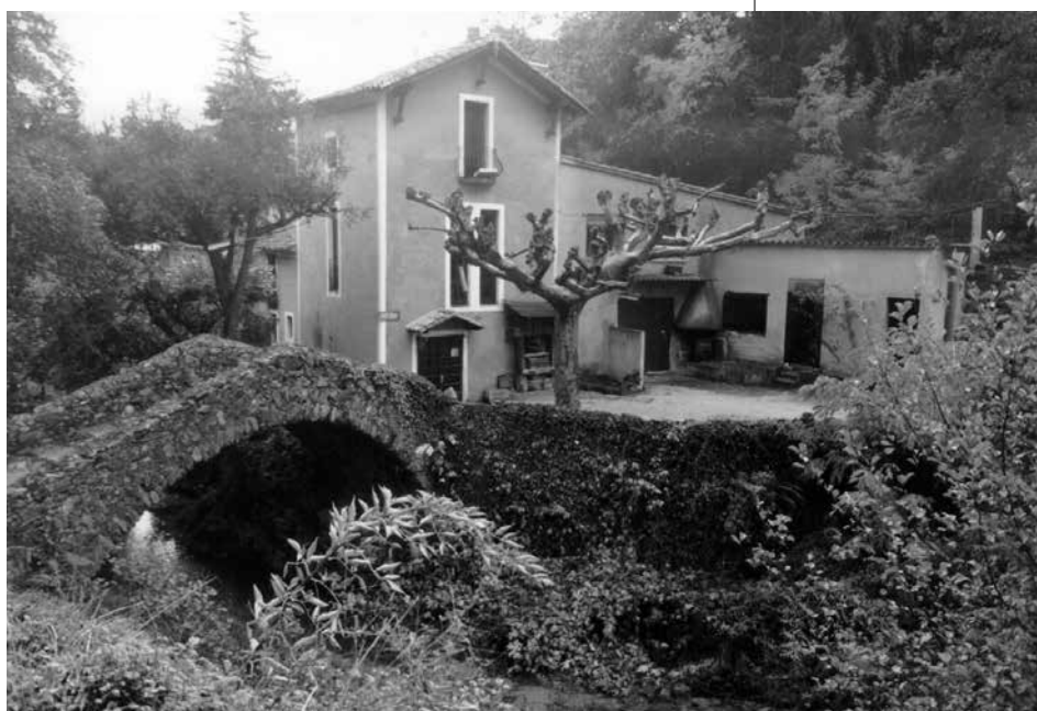
Pont del Molí de les Pipes