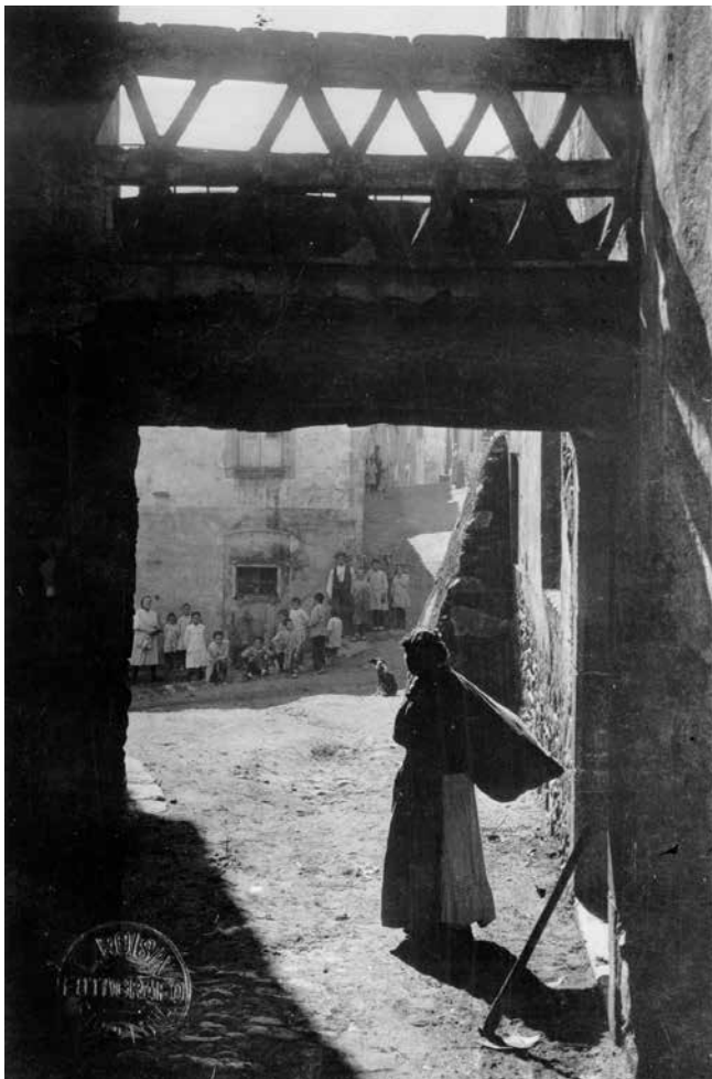
Veïnat del Castell

En els documents del s. XII, algunes de les cases incorporaven el nom del veïnat: el Sobirà de les Orses, el Morer de les Orses i l'actual Ridorsa.