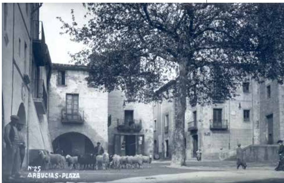
Veïnat de la Plaça

Formen aquest veïnat els carrers Major, del Damunt, plaça de la Vila, Segimon Folgaroles, Loreto Mataró, Turó d'Arenys, Turó de l'Home, Santa Fe,