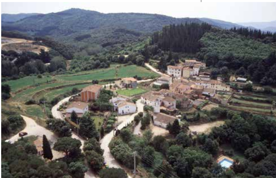
Veïnat de Joanet

Aquest veïnat, a mitjan s. XX encara celebrava la seva festa el dilluns de Pasqua Florida, darrera-